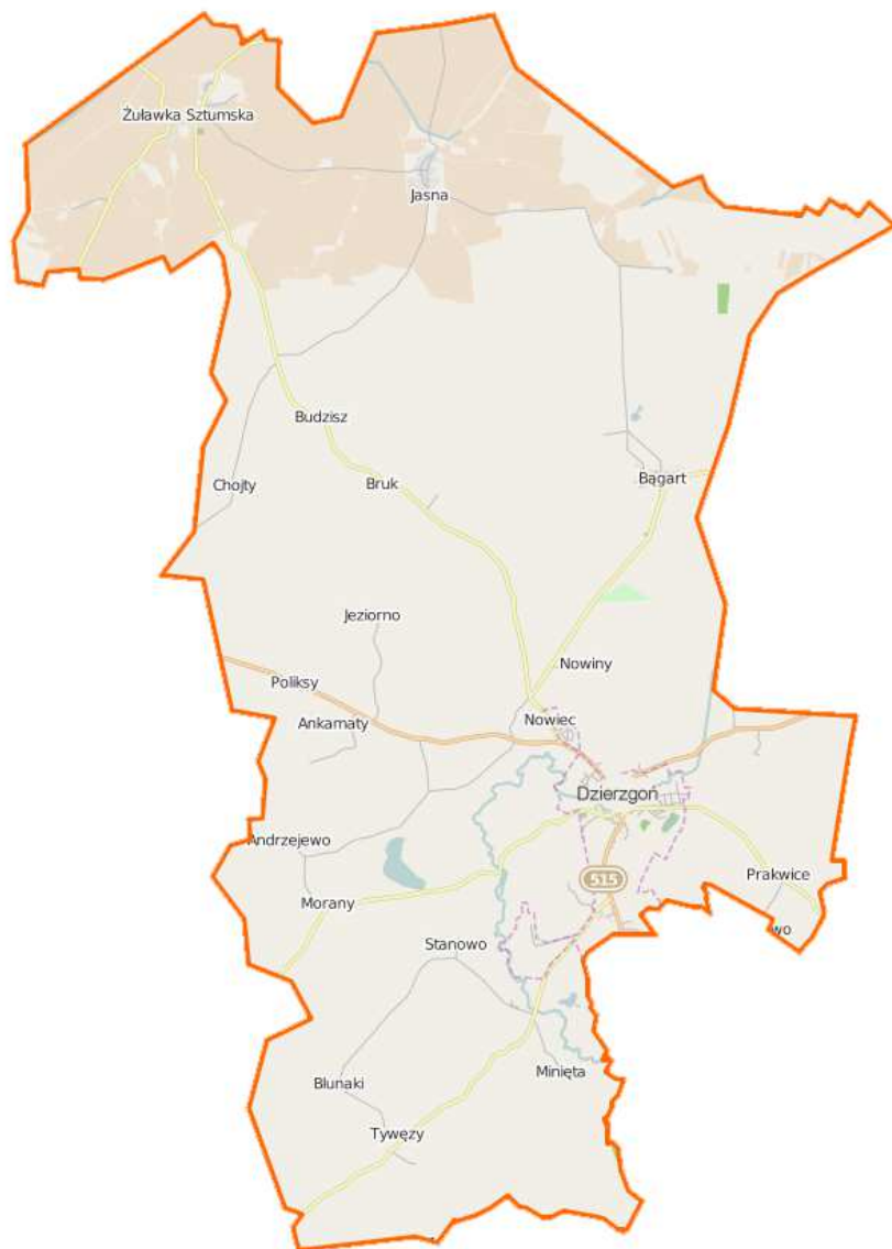
Plan gminy Dzierżonów